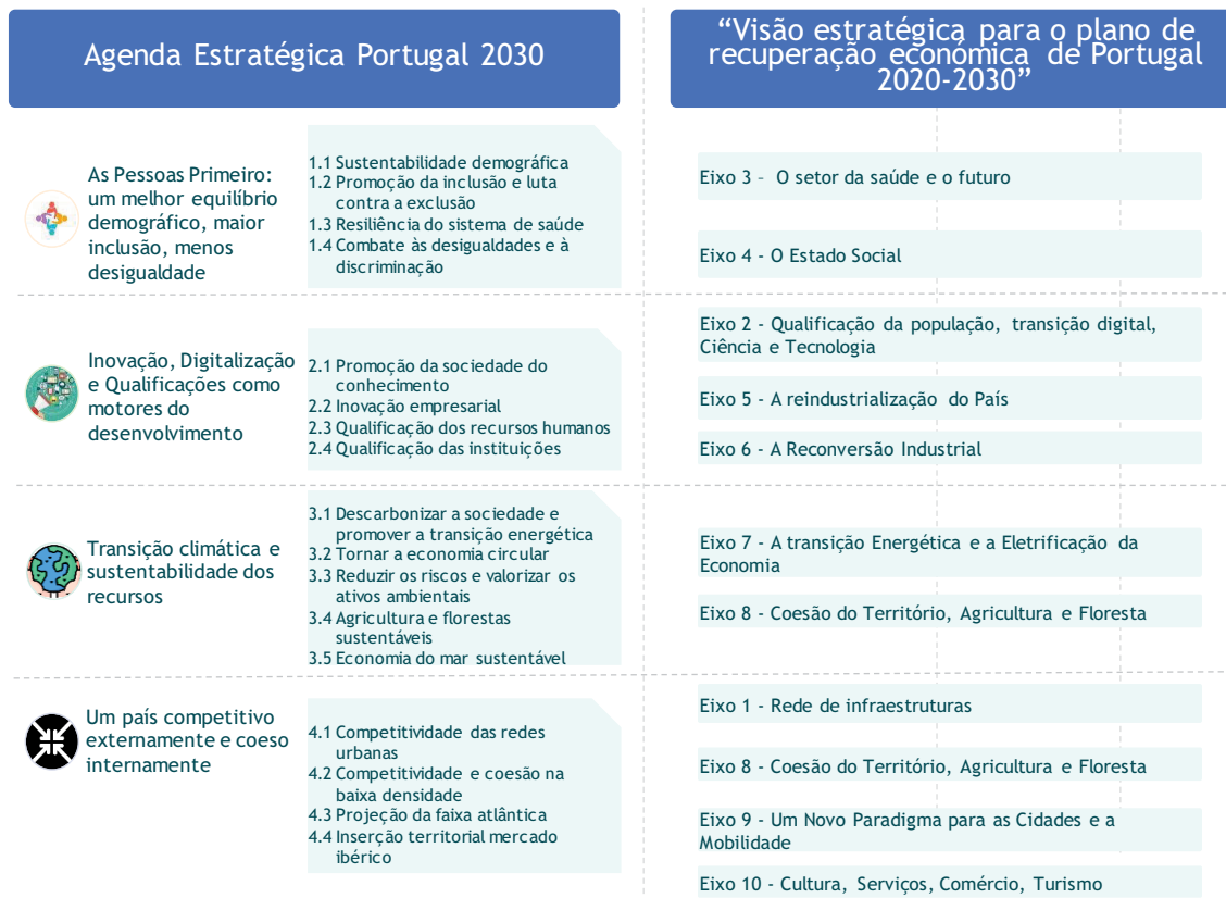
Figura 4 — Agendas temáticas da Estratégia Portugal 2030 e a visão estratégica

A Estratégia Portugal 2030 assume-se assim como a base estratégica para documentos de natureza programática transversal, como são as Grandes Opções e o Programa Nacional de Reformas, bem como dos programas estratégicos de mobilização de fundos europeus (Acordo de Parceria, PRR e o PEPAC) e os programas e planos setoriais que a venham a concretizar.