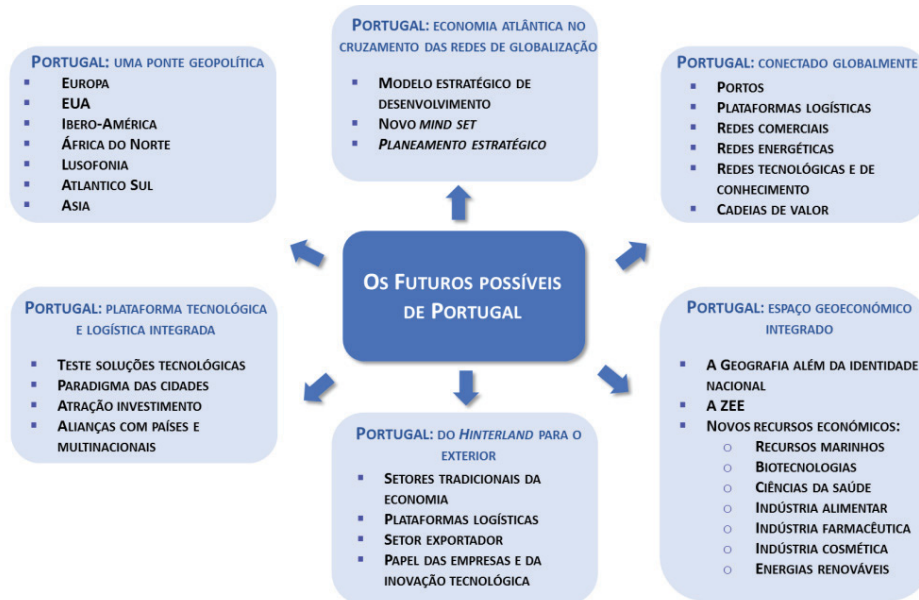
Figura 2 — Futuros possíveis de Portugal