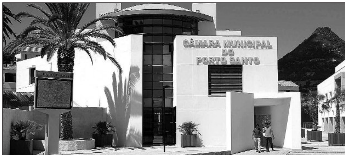
Os deputados municipais do Porto Santo chumbaram a proposta apresentada pelo executivo camário.

Miguel Fernandes mfernandes@jornaldamadeira.pt